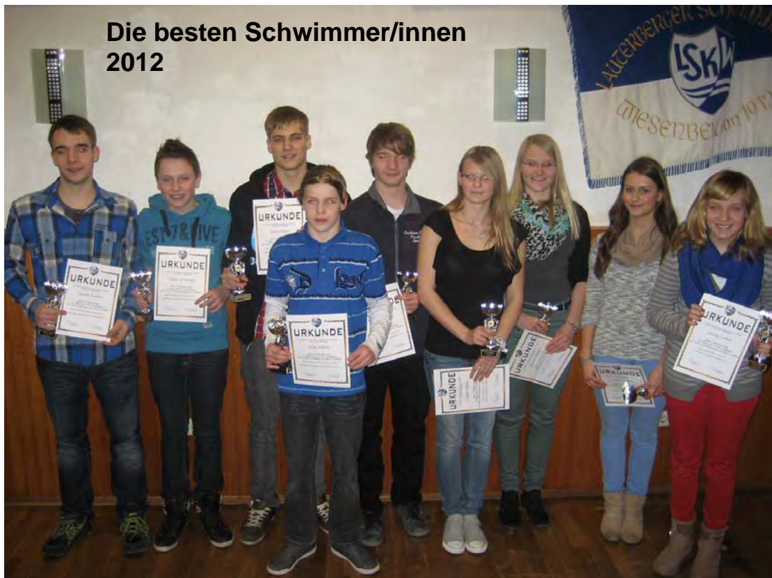
Die besten Skiläufer/innen 2012