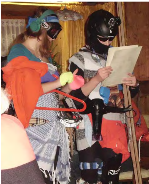
Die „Skiweisen“ bei der Arbeit.