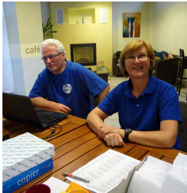
Die Sprecher und die Dateneingeber