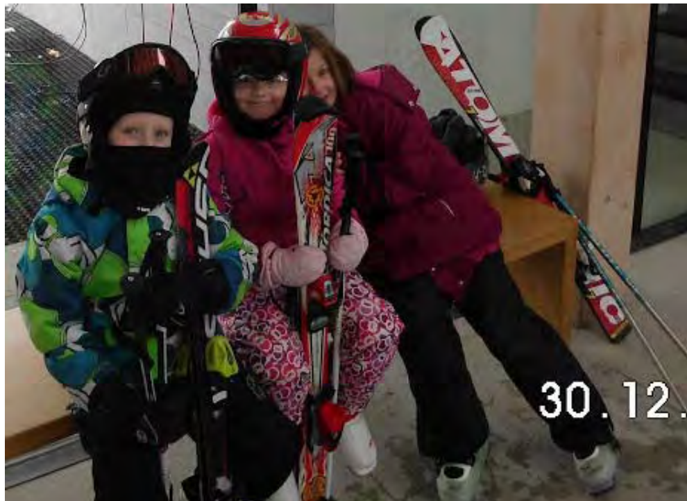
Die jüngsten Teilnehmer Der Skifreizeit.

Leider gab es nicht so viele Rennen für die Kinder ab der Klasse U12. Obwohl sie viel trainierten, hatten sie nur beim Eckold Pokal die Möglichkeit in unserer Region ihr Können unter Beweis zu stellen. Hoffentlich werden wir im nächsten Jahr bessere Bedingungen für die älteren Rennläufer haben.