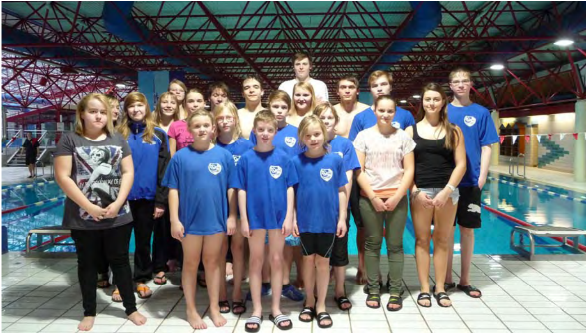
Der LSKW gewinnt den Mannschaftspokal 2013