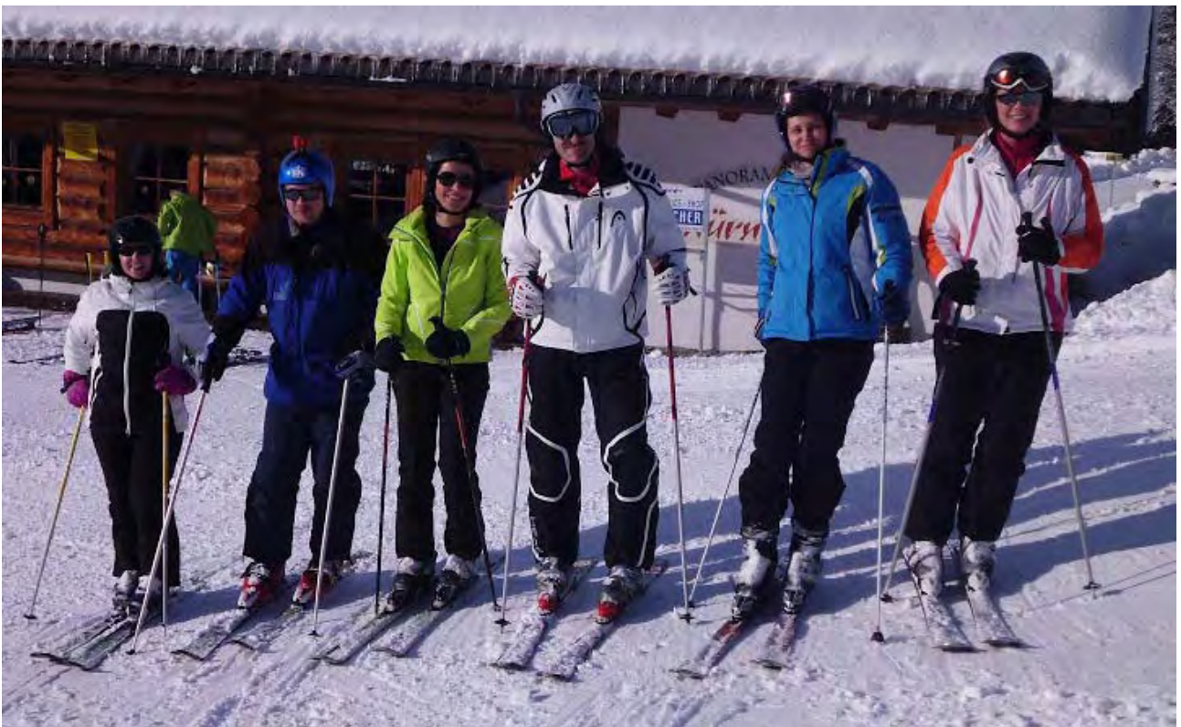
Impression aus der Skifreizeit