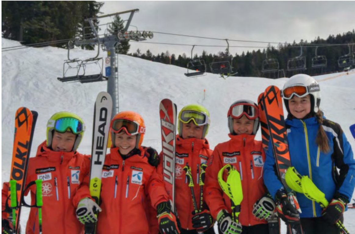
Erfolgreiche Wintersportler des LSKW 2017-2018