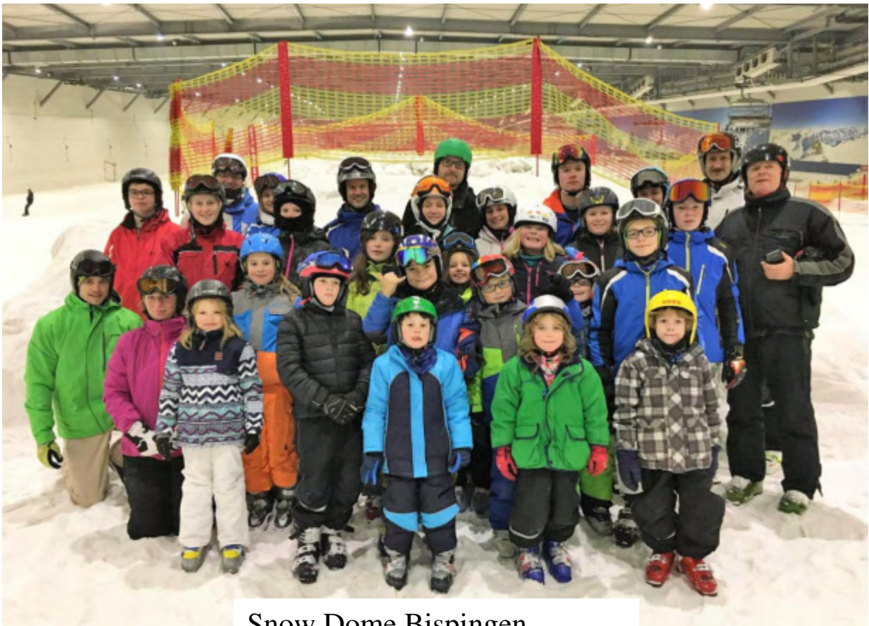
Snow Dome Bispingen

Mitteilungen des Lauterberger Schwimmklub Wiesenbek e.V. 1912 für seine Mitglieder Nr. 158 Bad Lauterberg im Harz Oktober 2018