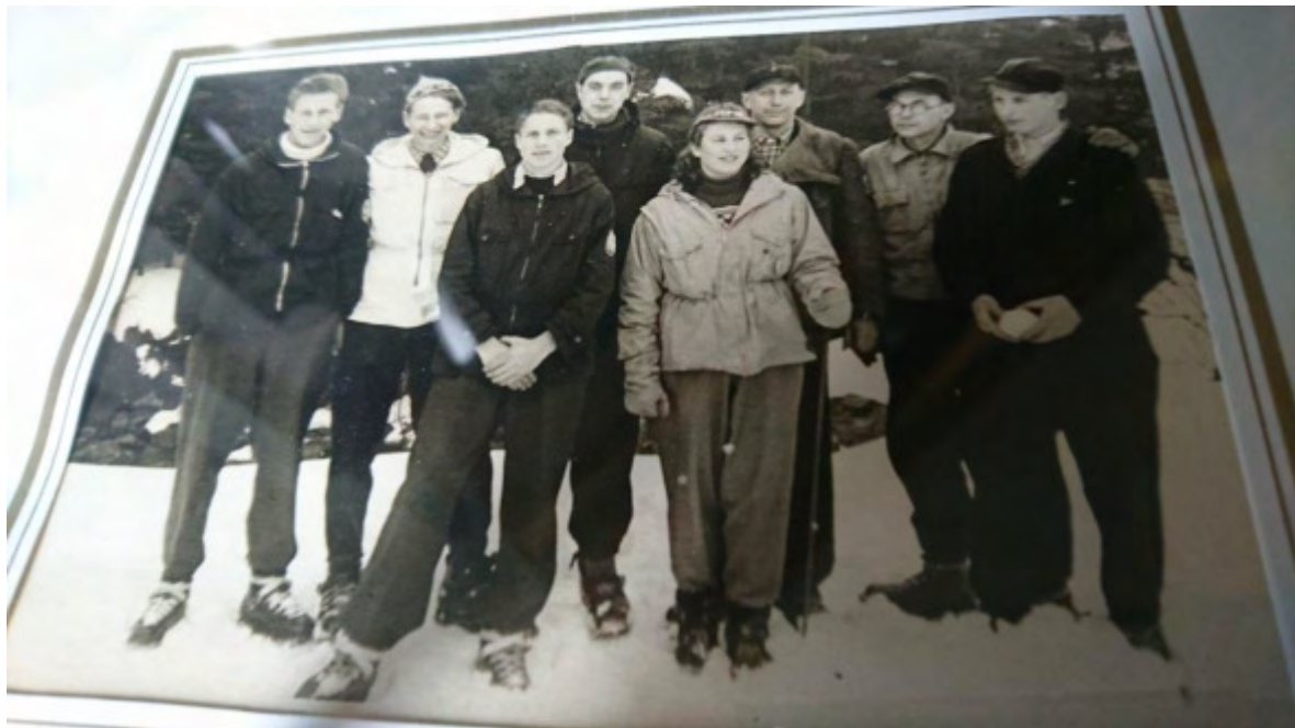
Erfolgreiche Wintersportler des LSKW in den 50 ern.