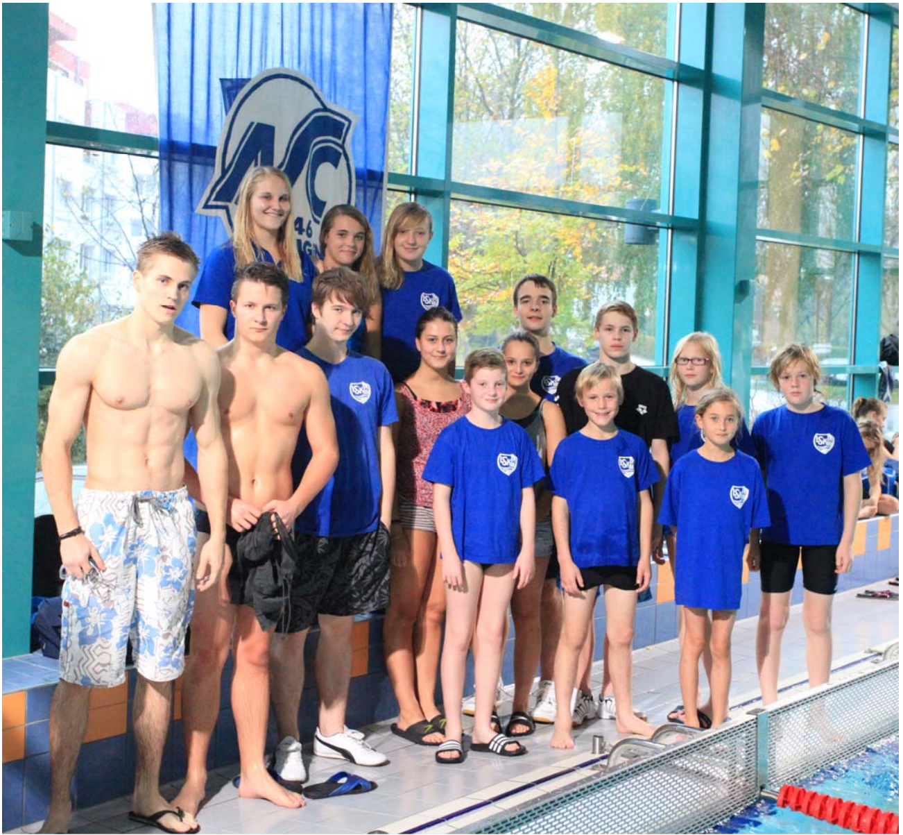
Die erfolgreiche Mannschaft des LSKW beim 31. Gänselieselschwimmfest in Göttingen.