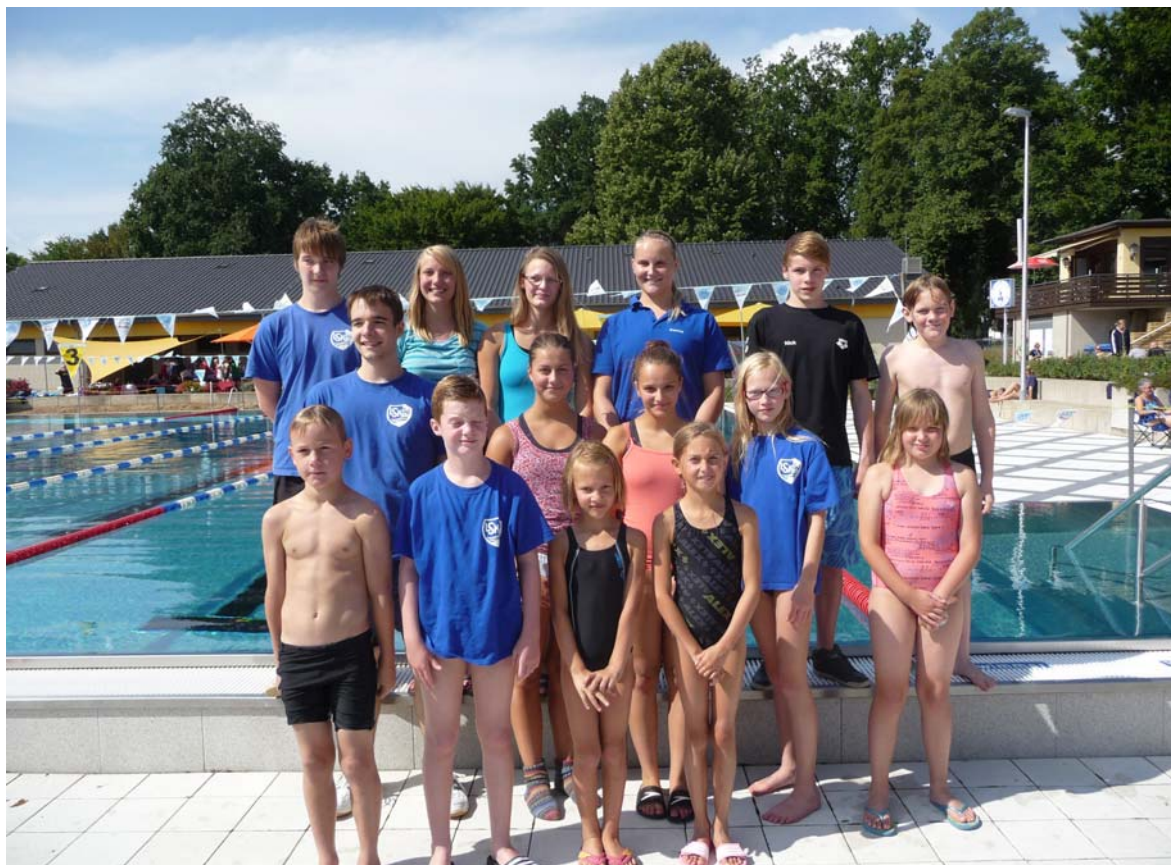
Die Jüngsten des LSKW in Goslar