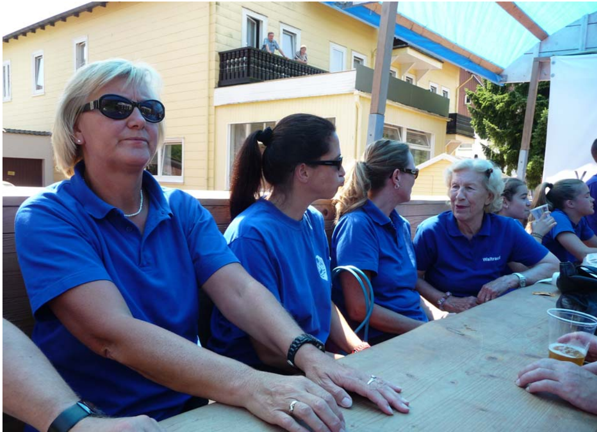
Hoch auf dem blauen Wagen.