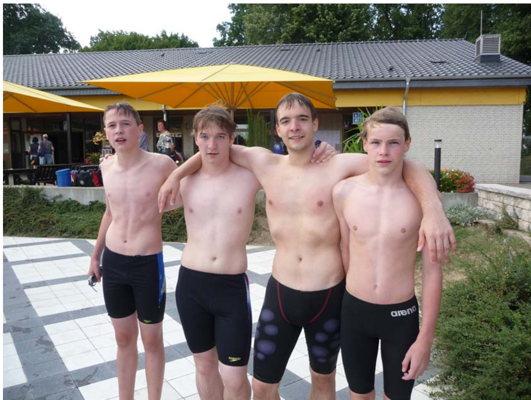
Die Staffeln des LSKW belegten Platz 1