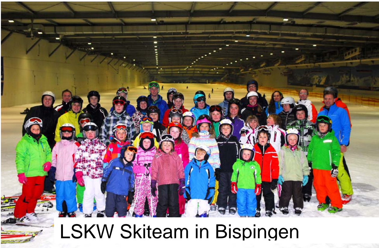
LSKW Skiteam in Bispingen